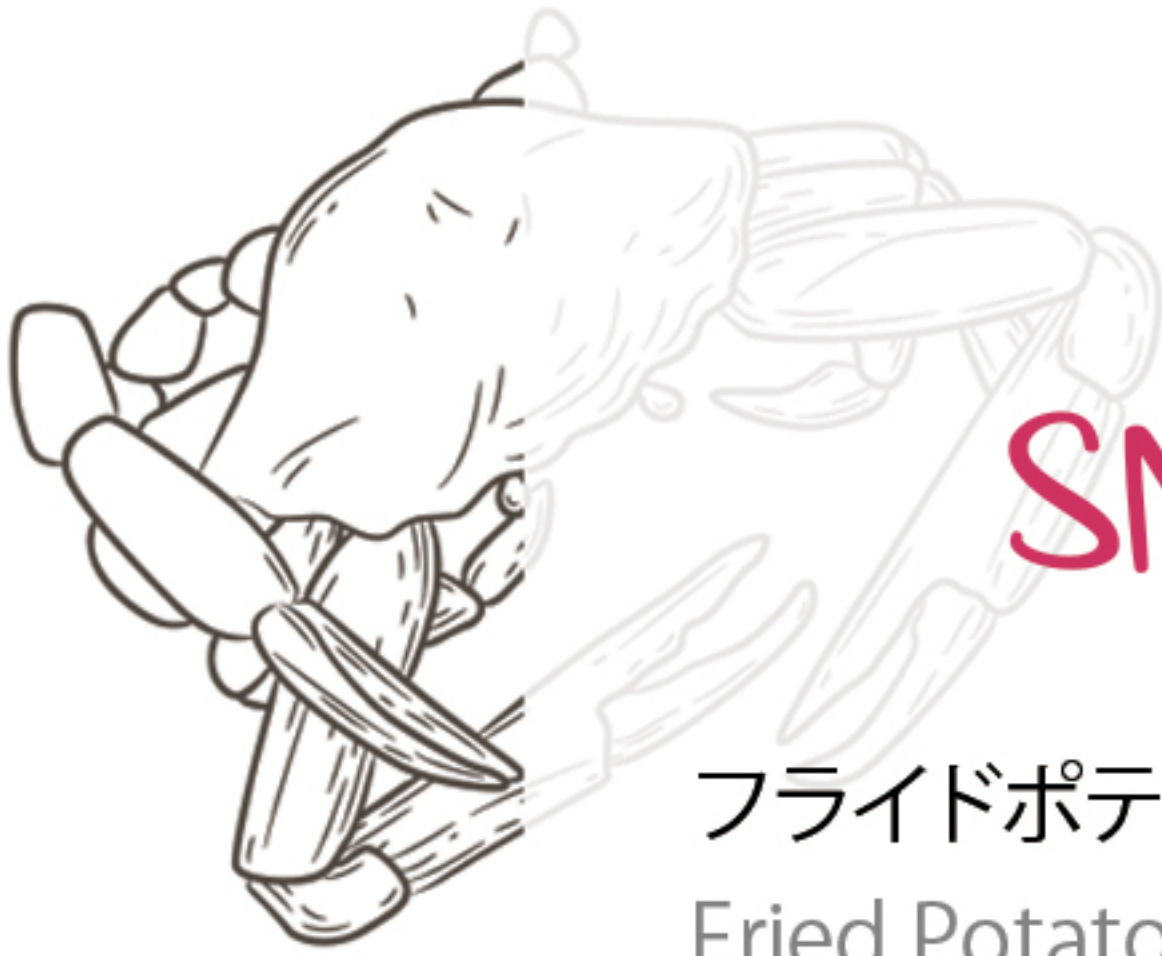
フライドポテト Fried Potato